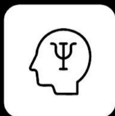
Programa de atención médica