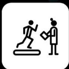
Programa de acondicionamiento físico