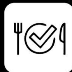
Programa de nutrición virtual